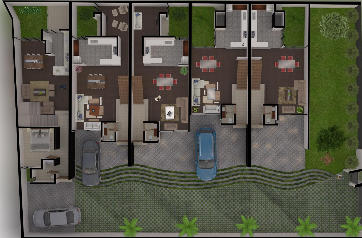
VISTA PLANTA BAJA GENERAL